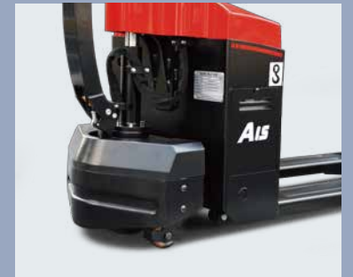
Dispone de ruedas auxiliares para una mayor estabilidad