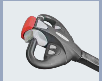
Timón de marca Rema